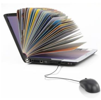
Схема библиографического описания электронного ресурса:

- удаленного доступа (с информацией на винчестере либо других запоминающих устройствах или размещенной в информационных сетях, например в Интернете).