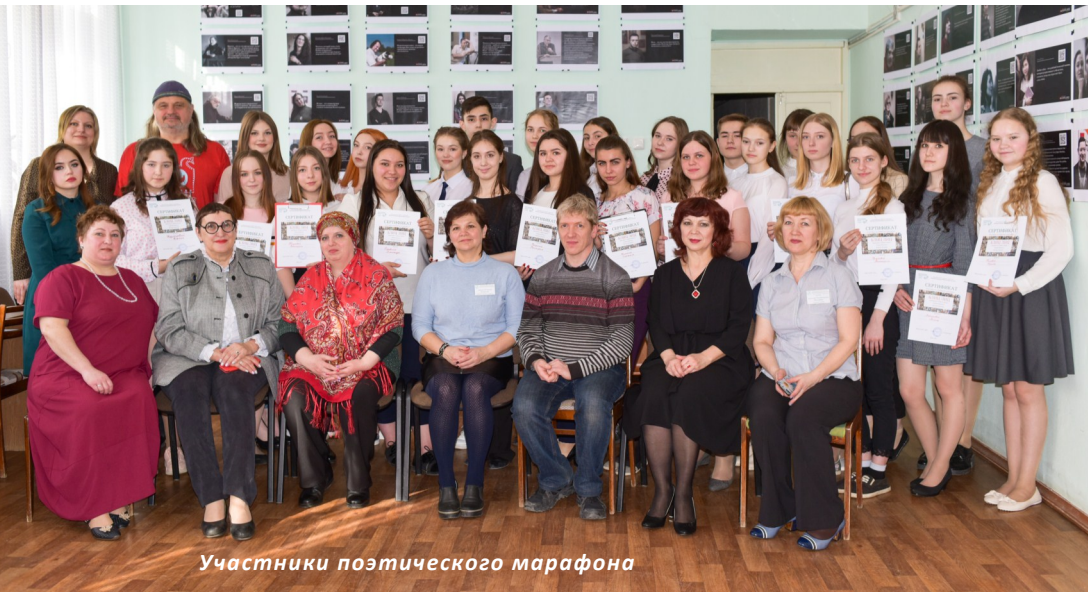
Участники поэтического марафона