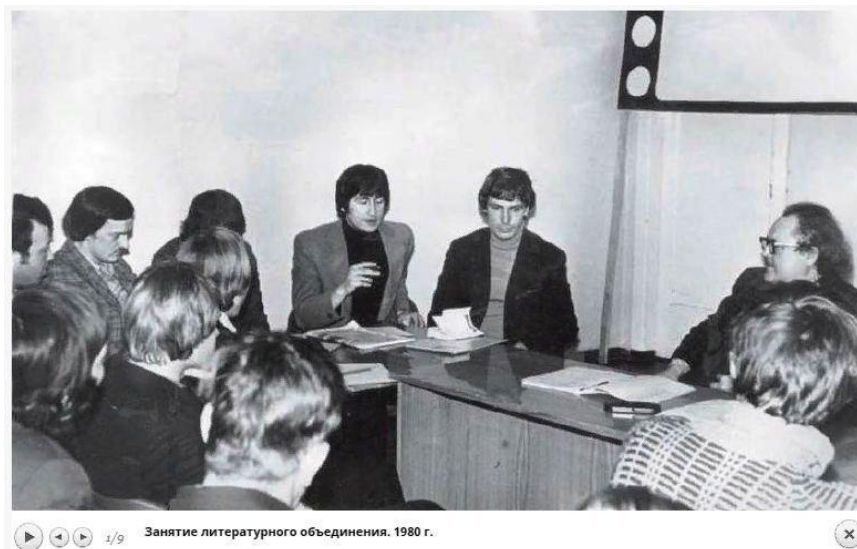
Занятие литературного объединения. 1980 г.