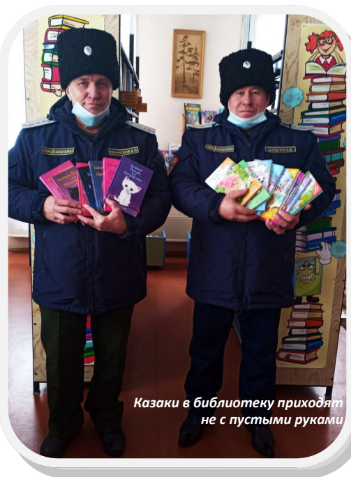
Казачи в библиотеку приходят не с пустыми руками

В феврале во Всемирный день книгодарения миасские библиотекари подвели итоги акции «Новые книжки миасским ребятишкам». Благодаря подаркам от читателей фонды библиотек пополнились 308-ю новыми книжками! Кроме того, библиотекам были подарены еще 190 книг, пусть не совсем новых, но востребованных читателями! Таким образом, общее количество подаренных книг — 498!