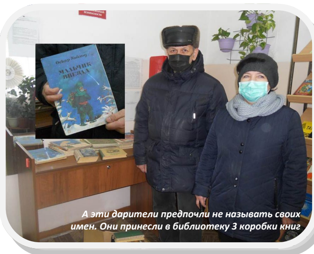
А эти дарители предпочли не называть своих имен. Они принесли в библиотеку 3 коробки книг

Дорогие читатели, поздравляем вас с Днем защитника Отечества!