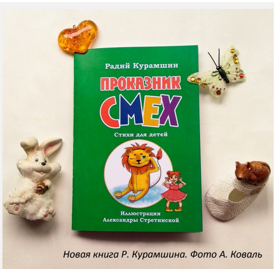
Новая книга Р. Курамшина.

Презентация новой книги «Проказник Смех» прошла без его