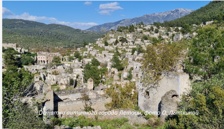
Останки античного города Летаон

ров длиной. Черепашки на нем откладывают яйца. Когда-то Патара был центральным городом Ликийи. Правда, сейчас об этом спорят ученые. Это одно из немногих мест в Турции, где сегодня идут восстановительные работы. Оксана побывала в древнем амфитеатре, в ликийских гробницах. Печально, что огромное количество археологических памятников просто брошено, местные жители используют в хозяйстве «осколки культурного наследия» Ликийского государства.