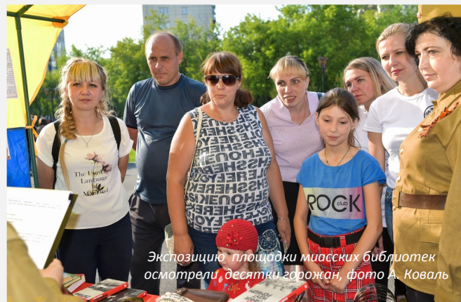
Экспозицию площадки миасских библиотек посетили, десятки горожан, фото А. Коваль