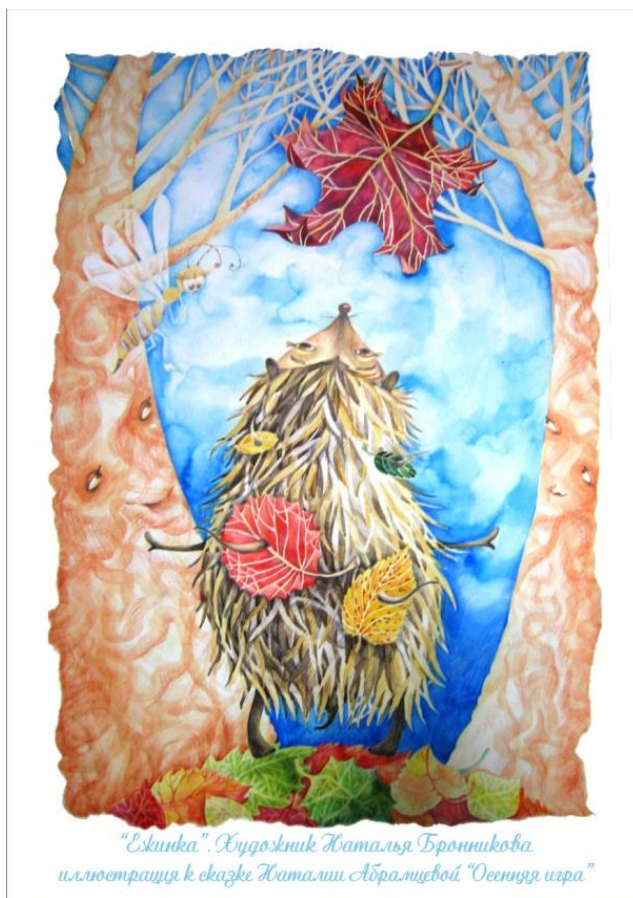
Иллюстрация к сказке Н. Абрамцевой «Осенняя игра» миасской художницы Н. В. Бронниковой

8. Д/З. Нарисовать рисунок к сказке «Осенняя игра»