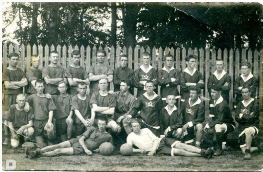
11 июля 1926 года. Миасские футболисты перед матчем. Слева — команда «Сокол», справа — «Красный петух».