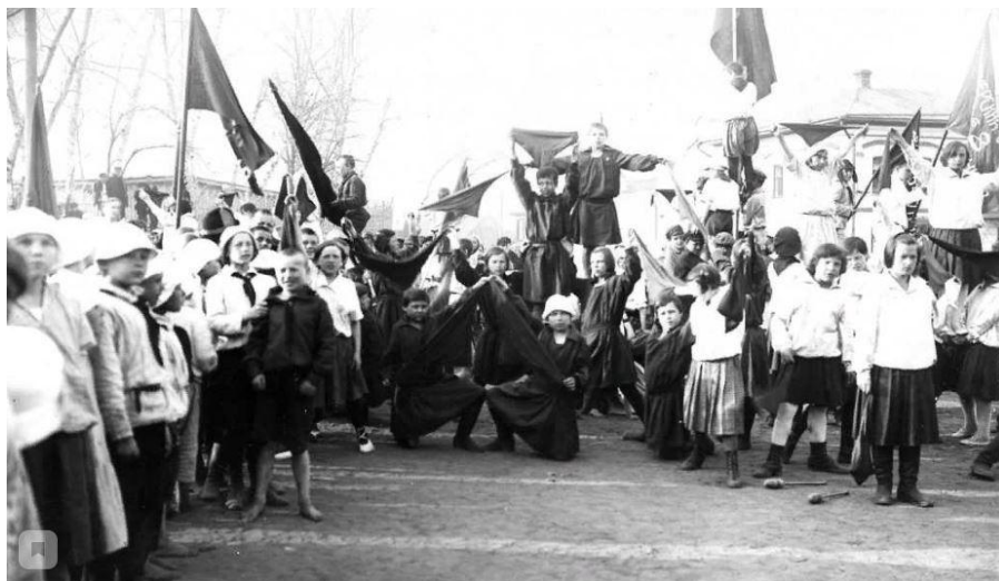
Непрерывным атрибутом всех массовых праздников в 1920-е годы были «живые пирамиды». При их «строительстве» нужно было проявить и спортивные, акробатические навыки. На снимке – миасские пионеры на первомайской демонстрации 1925 года.