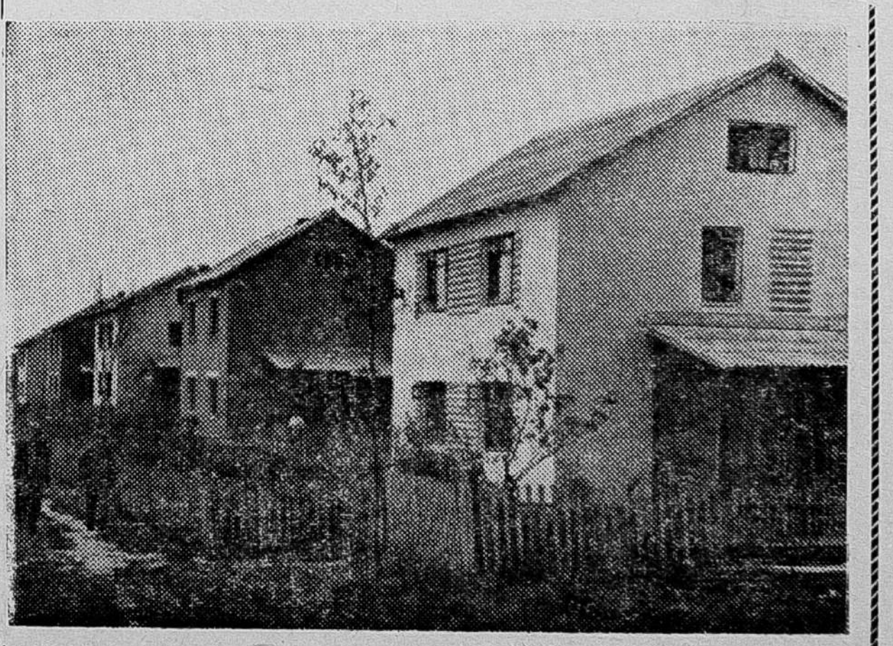
★ СМОЛЕНСКАЯ ОБЛАСТЬ. В колхозе «Рассвет» Ельнинского района с помощью преподавателей и студентов Московского архитектурного института разработан генеральный план строительства нового колхозного села. Колхоз приступил к осуществлению проекта. Уже построено шесть двухэтажных домов.

МОСКВА, 18 сентября. Готовя достойную встречу XXII съезду КПСС, хлеборобы Воронежской области успешно провели уборку колосовых культур и выполнили принятые социалистические обязательства по увеличению производства и продажи хлеба государству. Колхозы и совхозы области на 15 сентября сдали и продали государству 63,7 миллиона пудов зерна — на 19,2 миллиона пудов больше, чем за весь прошлый год. План продажи пшеницы выполнен на 196,3 процента, зернобобовых — на 103 процента.