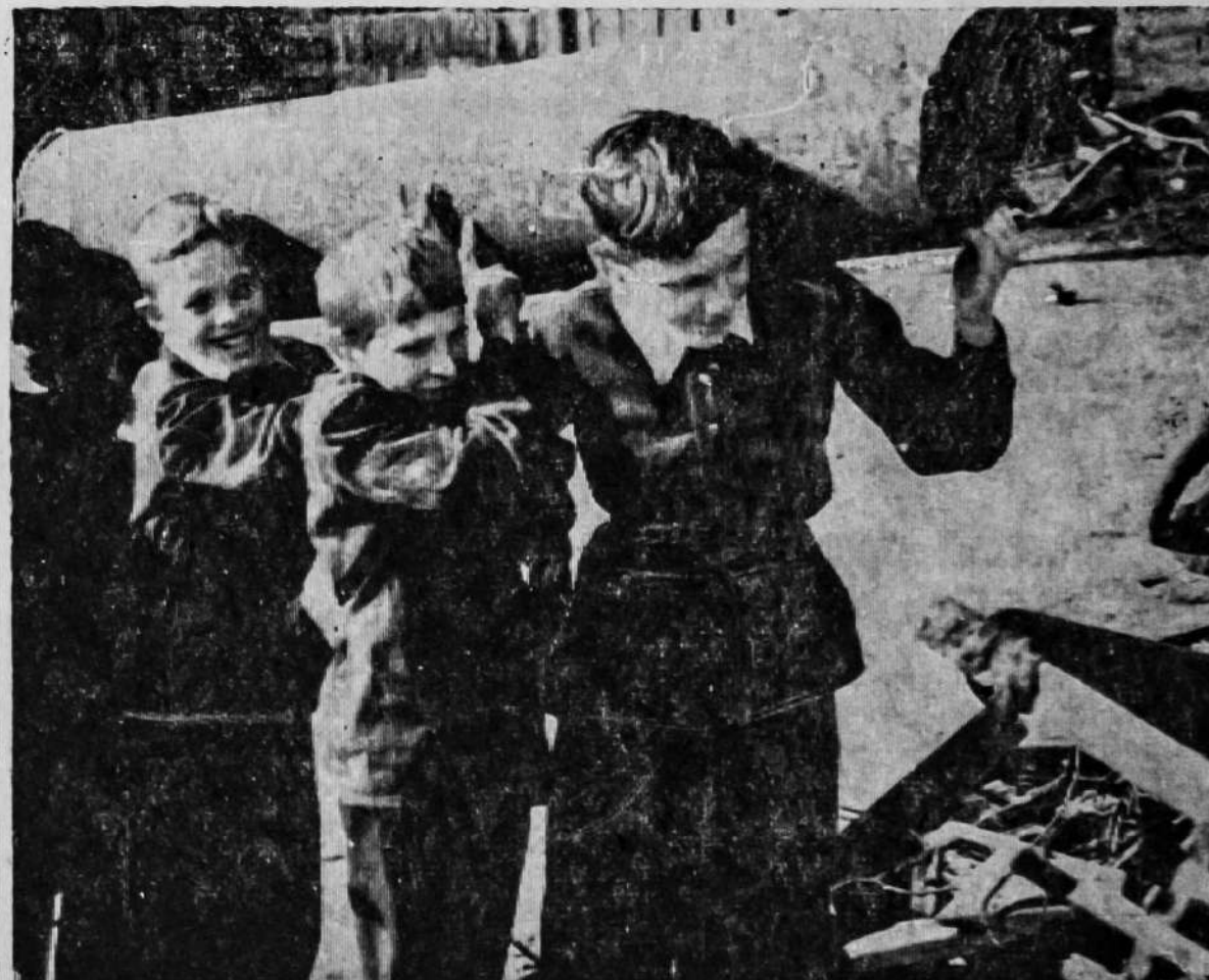
Фото С. Крылова.

ВСЕ МАТЕРИАЛЫ ЭТОЙ СТРАНИЦЫ ПОДГОТОВЛЕНЫ НЕШТАТНЫМ ОТДЕЛОМ КОМСОМОЛЬСКОЙ ЖИЗНИ