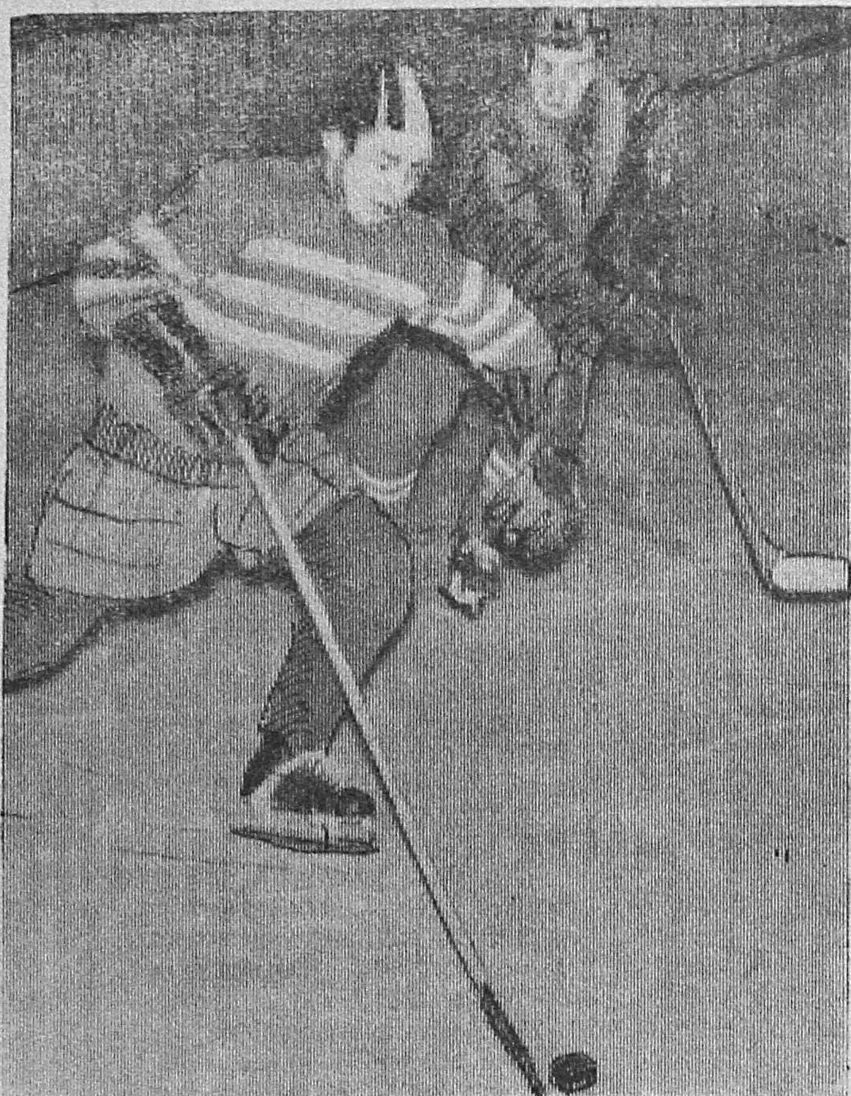
НА СНИМКЕ: момент игры между командами автозаводцев и Челябинского кузнечно-прессового завода.