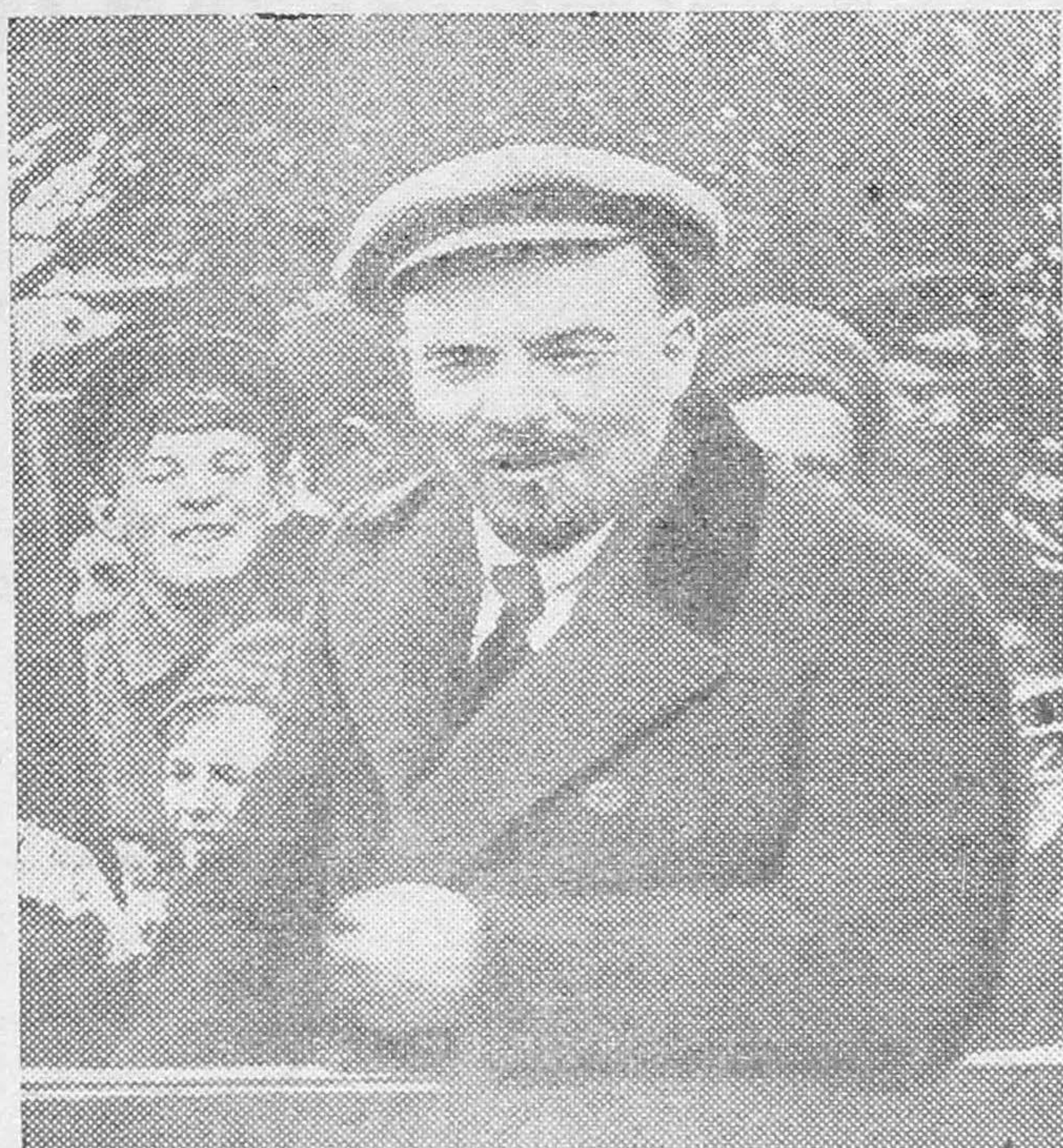
В. И. Ленин у рабочих Рублевской водоканчки. 4 мая 1919 года (кинокадр). (Из альбома, подготовляемого к выпуску Институтом марксизма-ленинизма при ЦК КПСС).

Коллектив работников библиотеки готовит сейчас тематические вечера о В. И. Ленине. Первый такой вечер намечено провести 28 февраля. С воспоминаниями о встречах с Лениным выступают ветераны революции и старые большевики.