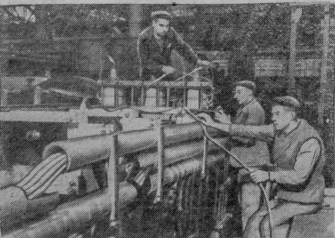
МОСКВА. Сверхмощный трехфазный трансформатор на напряжении 220 тысяч вольт изготавливают сейчас в одном из цехов электроразвода.

Кружковцы договорились о том, чтобы вместо итоговых занятий провести теоретическую конференцию по материалам январского Пленума ЦК КПСС об увеличении производства продуктов сельского хозяйства. К этой конференции в кружке развернулась подготовка.