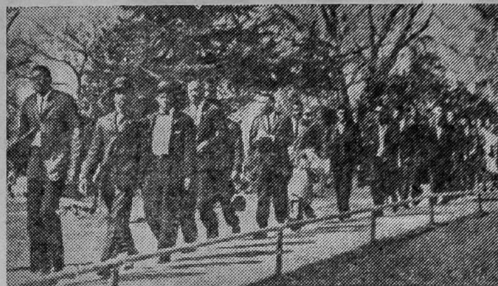
Соединенные Штаты Америки. Участники демонстрации негров против сегрегации. Они прошли перед зданием законодательного собрания города Колумбия (штат Южная Каролина). Агентство Ассошиэтед Пресс, распространяя этот снимок, сообщило, что позднее демонстранты были арестованы полицией.