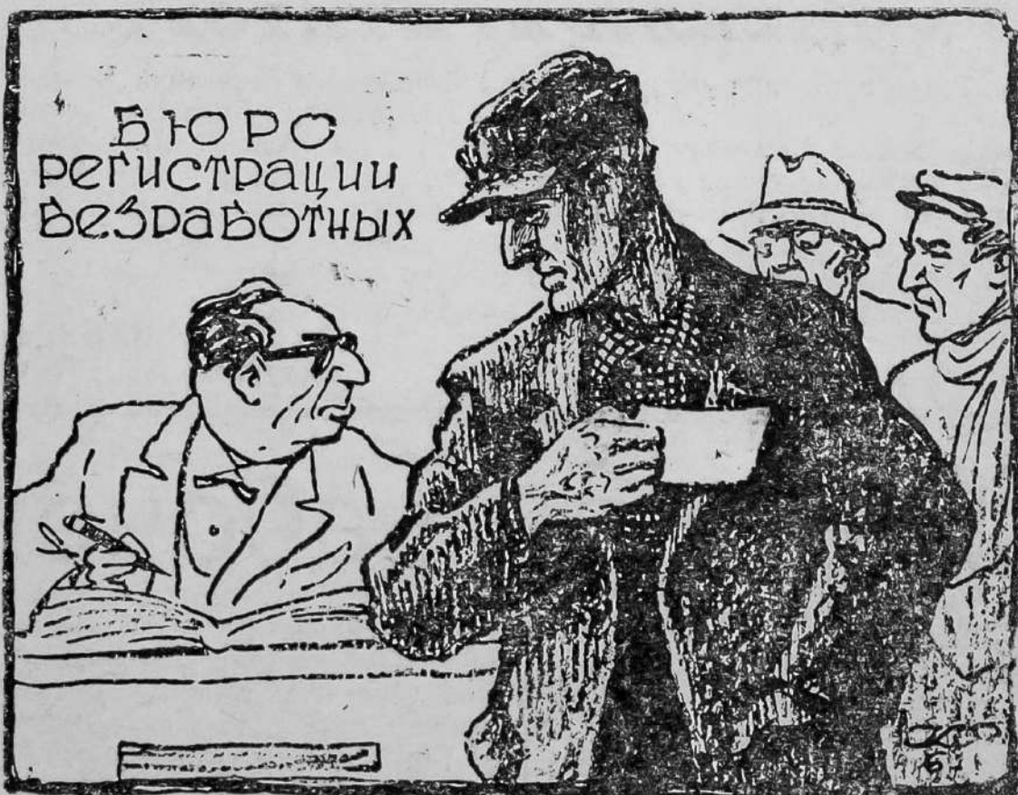
—Ну, этому-то чиновнику безработица не угрожает! Рис. К. Елисеева.

В США количество безработных превышает 5,5 миллиона человек.