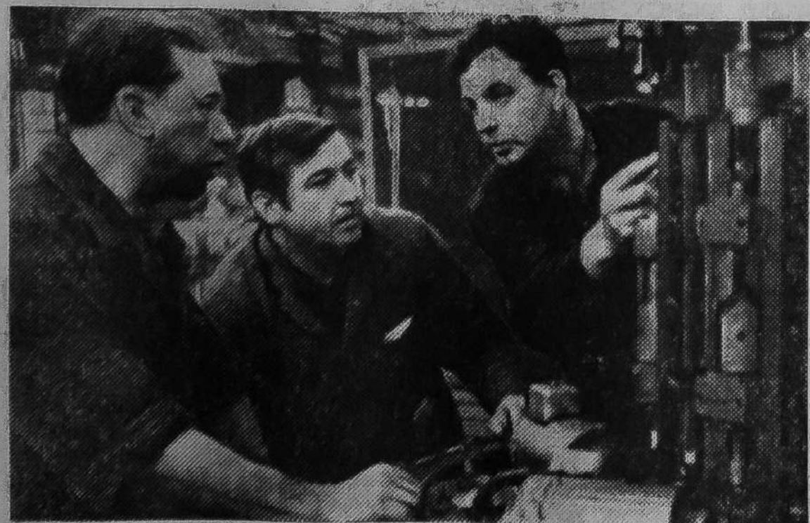
В ЧИСЛЕ коллективов московских предприятий, награжденных за высокие показатели в социалистическом соревновании

ГРИШИН В. В. ДЕМИЧЕВ П. Н. КУНАЕВ Д. А. МАШЕРОВ П. М. МЖАВАНАДЗЕ В. П. РАШИДОВ Ш. Р. УСТИНОВ Д. Ф. ЩЕРБИЦКИЙ В. В. КАПИТОНОВ И. В. КАТУШЕВ К. Ф. КУЛАКОВ Ф. Д. ПОНОМАРЕВ Б. Н. СОЛОМЕНЦЕВ М. С.