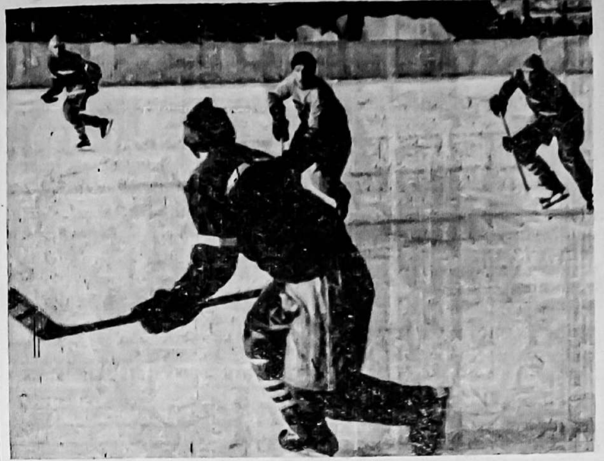
На хоккейном поле.