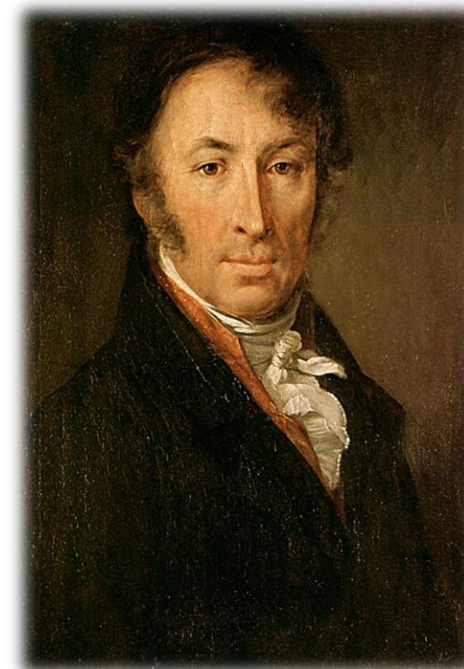
Николай Михайлович КАРАМЗИН (1766 – 1826)