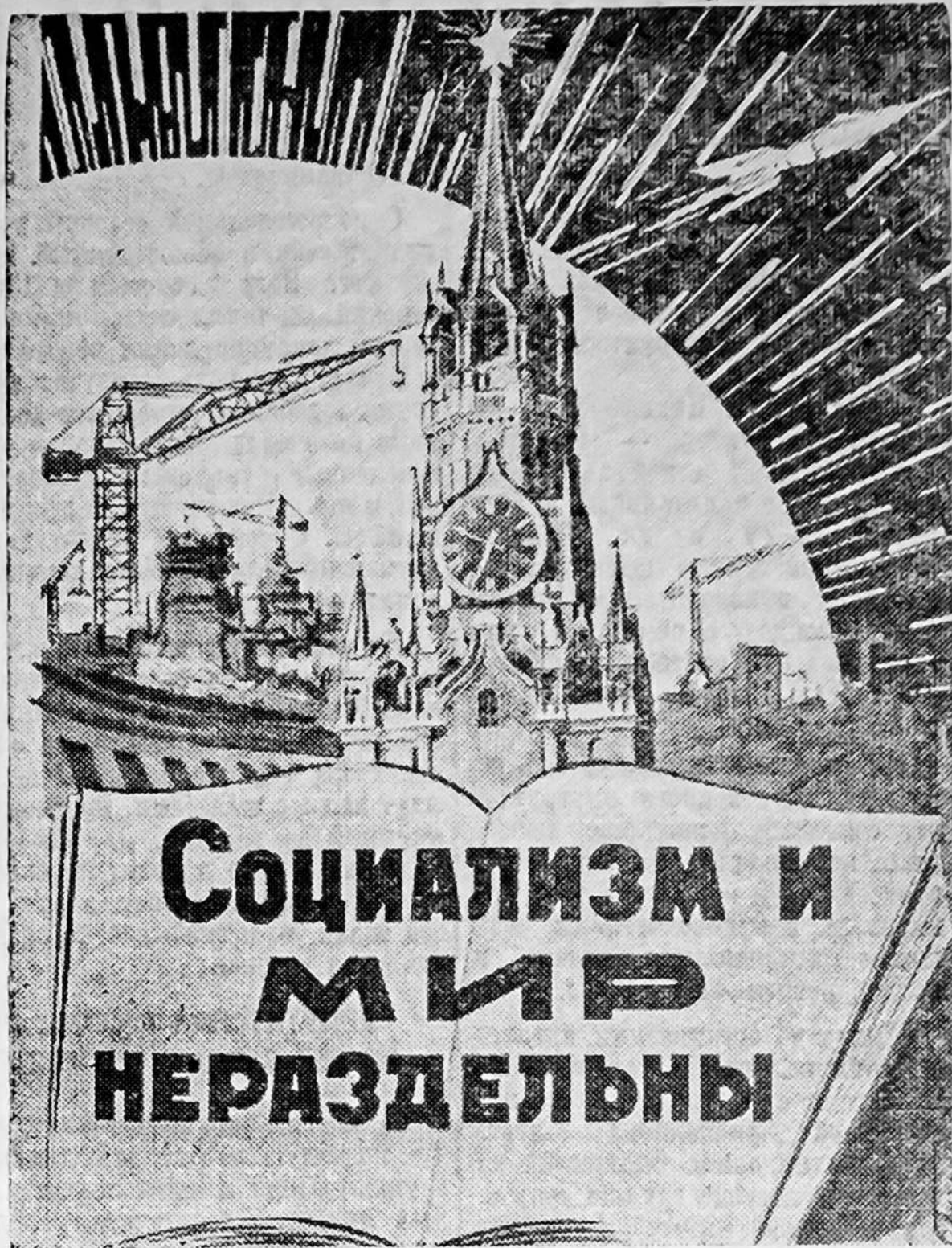
Плакат художника Б. Антонова.

Труженики прядильно-ткацкой фабрики «Октябрьская» начали соревнование за достижение наивысшей в Советском Союзе производительности на однотипном оборудовании. Они приняли обязательство—в IV квартале 1961 г. достичь наивысшей в стране производительности труда.