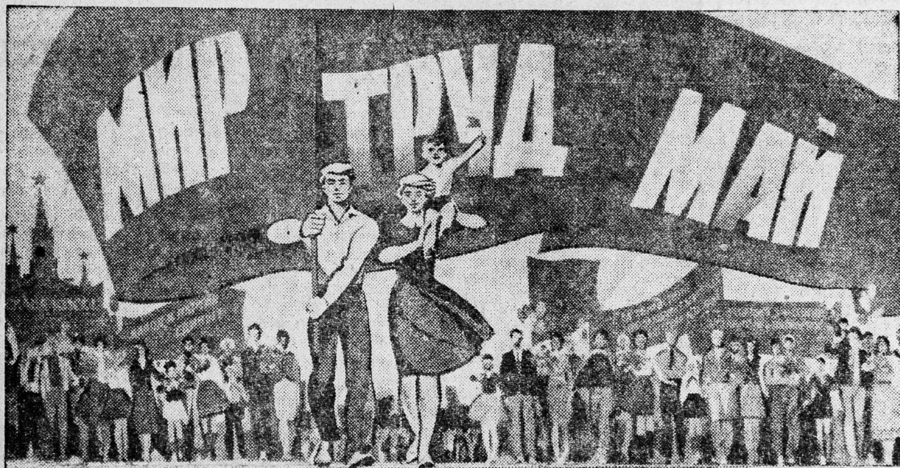
Плакат художника В. Сачкова. Издательство «Плакат».