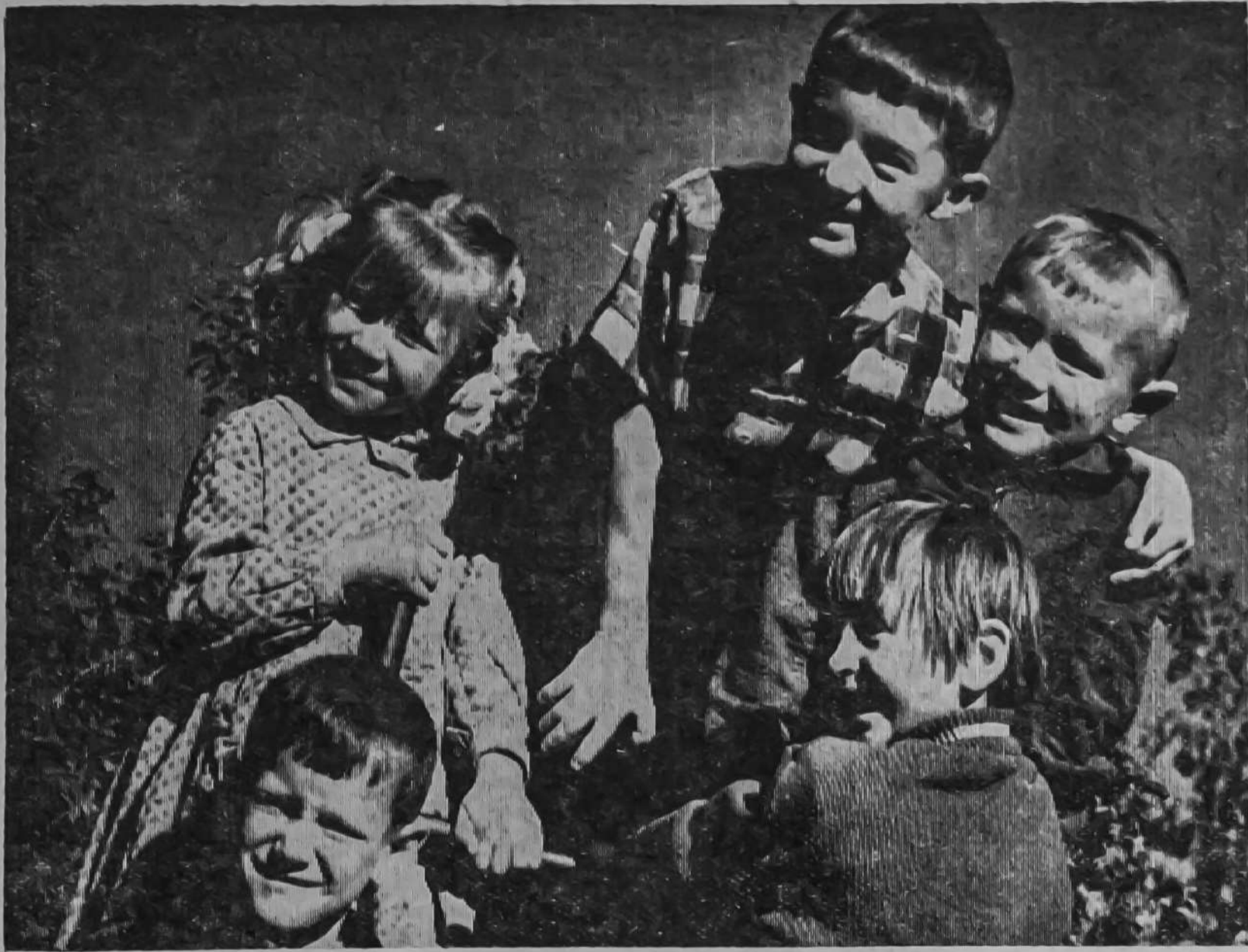
Вот они, веселые, жизнерадостные, здоровые. Их будущее оберегает Родина, они станут достойными преемниками старших поколений.