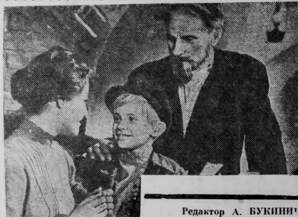
Редактор А. БУКИНИЧ.

Кадр из нового кинофильма «Заре навстречу» производства киностудии «Мосфильм». Постановка Татьяны Лукашевич. Сценарий А. Антокольского.