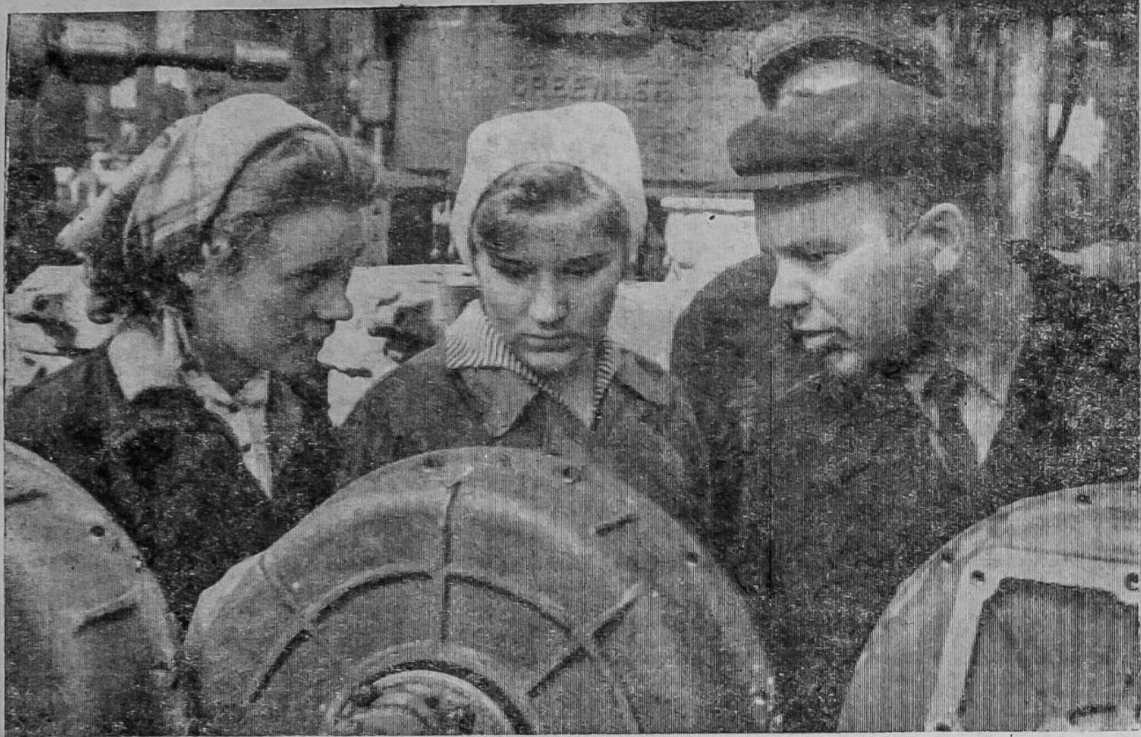
По столбцам стенгазет