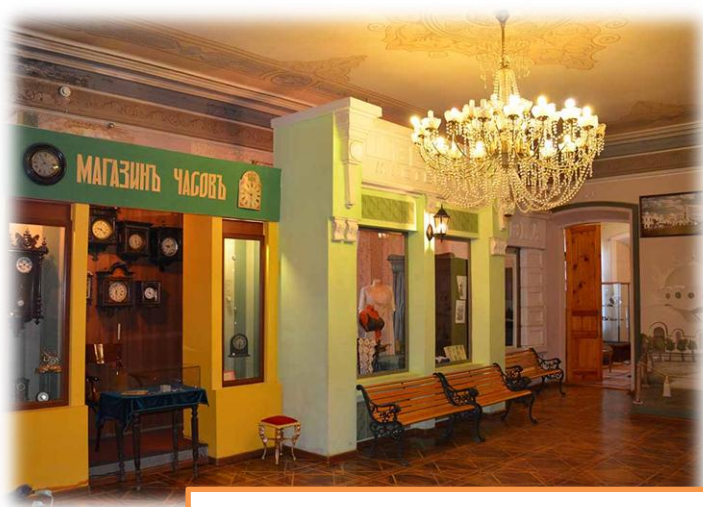
Экспозиция «Улица Миасского завода»

Музей – особое учреждение. Посещение музея учит неторопливому, спокойному, уважительному отношению к наследию, к истории, к памятникам.