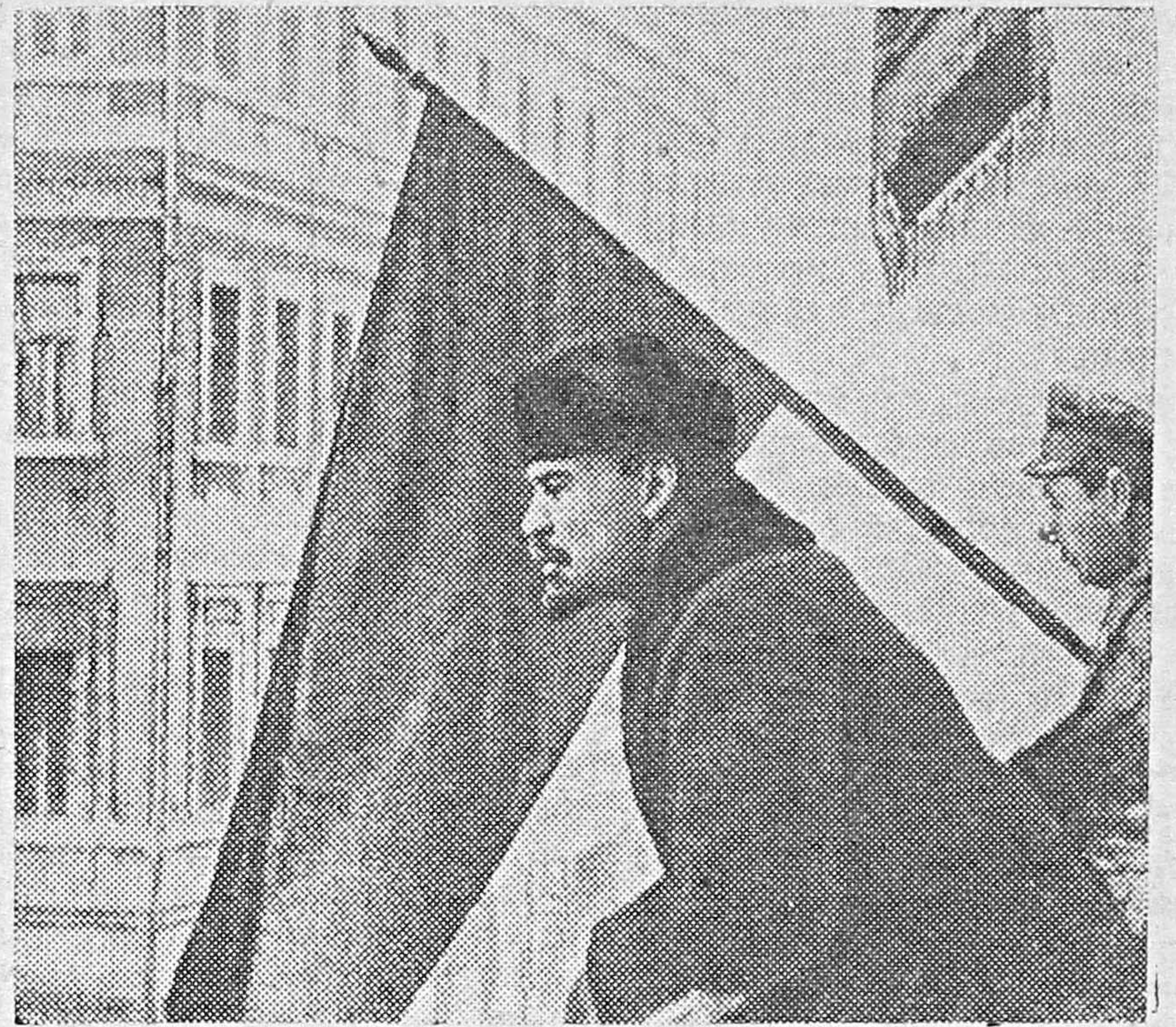
В. И. Ленин выступает с балкона Моссовета с приветствием перед бойцами-коммунистами, отправляющимися на борьбу с Деникиным. Москва, 16 октября 1919 года (кинокадр). (Из альбома, подготовляемого к выпуску Институтом марксизма-ленинизма при ЦК КПСС).

Повсюду в городе сейчас развернулась подготовка к 90-летию со дня рождения Владимира Ильича Ленина. Многие коллективы предприятий в честь этой даты встали на ленинскую вахту, стремясь встретить день рождения вождя трудящихся достойными трудовыми подарками. Надо в каждом номере стенгазеты обязательно публиковать письма, заметки и другие материалы, рассказывающие об успехах тружеников в дни ленинской вахты, ярче показывать, как в будничных делах советских людей воплощаются в жизнь ленинские идеи строительства коммунизма в нашей стране.