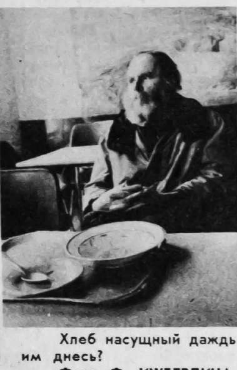
Хлеб насущный даждь им днесь?