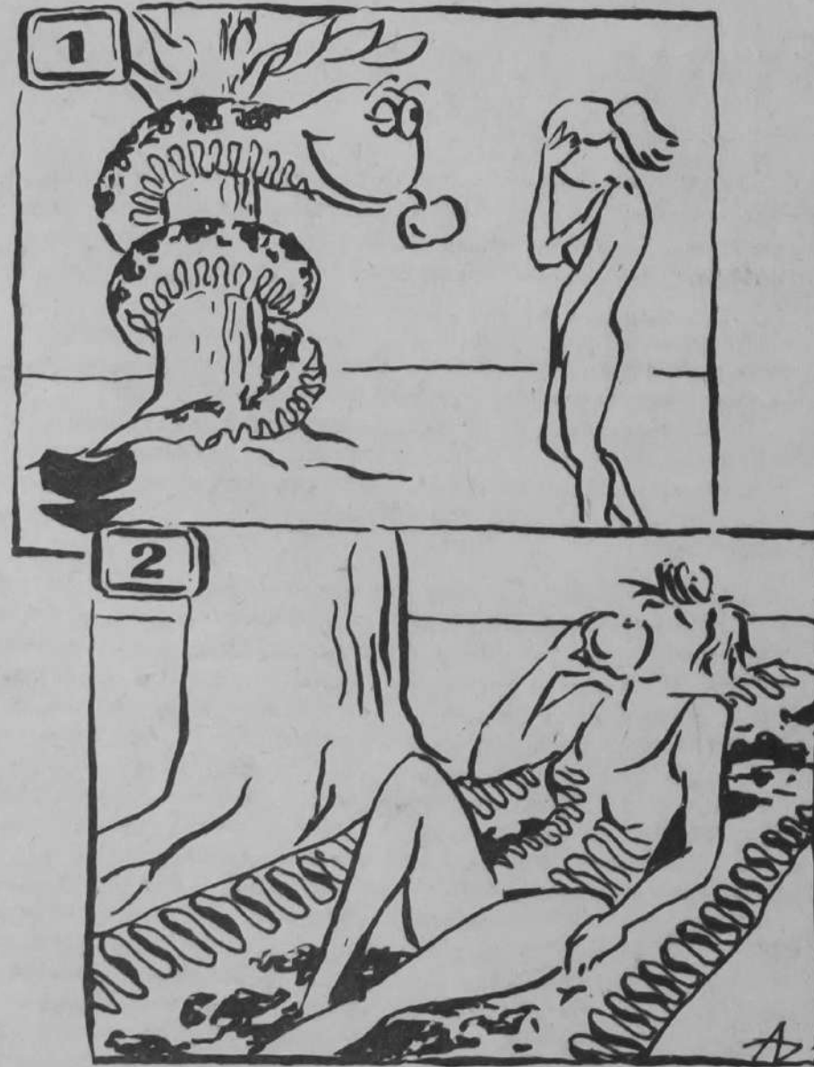
Рисунок А. Дернова.

Изограф-91 объявляет конкурс на лучшую подпись под этим комиксом. Свои предложения высылайте в адрес редакции до 1 сентября 1991 года. Победитель будет отмечен.