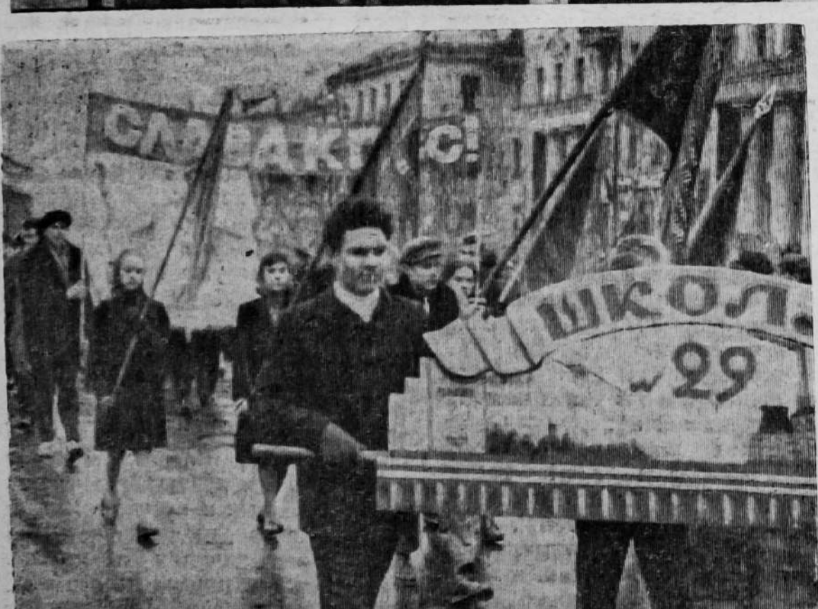
Колонны демонстрантов на главной улице города.

Трудящиеся индустриального Миасса вместе со всем советским народом торжественно отмечают 44-ю годовщину Великой Октябрьской социалистической революции в обстановке огромного политического и трудового подъема, вызванного историческими решениями XXII съезда КПСС.