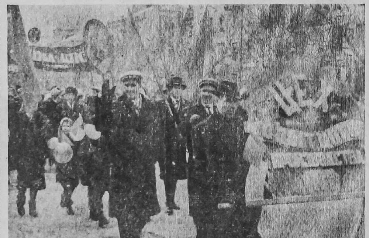
7 ноября 1964 года Колонны демонстрантов на центральной магистрали города — проспекте Автозаводцев.

Автотранспортники, мебельщики, лесники, работники службы быта и пищевых предприятий, советские служащие — все в этот день вышли на улицу, чтобы продемонстрировать преданность Родине, свое единство с великой Коммунистической партией.