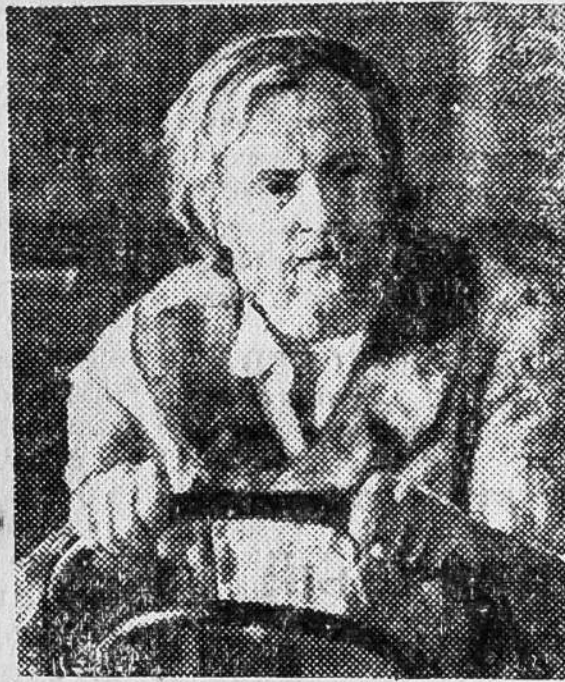
Фото В. Мاستюкова, Фотохроника ТАСС.

НА СНИМКЕ: Иннокентий Смоктуновский в роли дяди Вани.