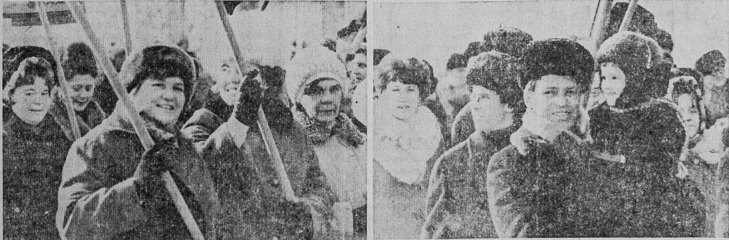
В колоннах демонстрантов 7 ноября.