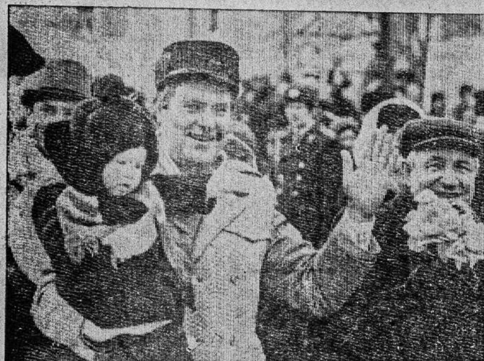
МИАССЫ В ПРАЗДНИЧНЫХ КОЛОННАХ.