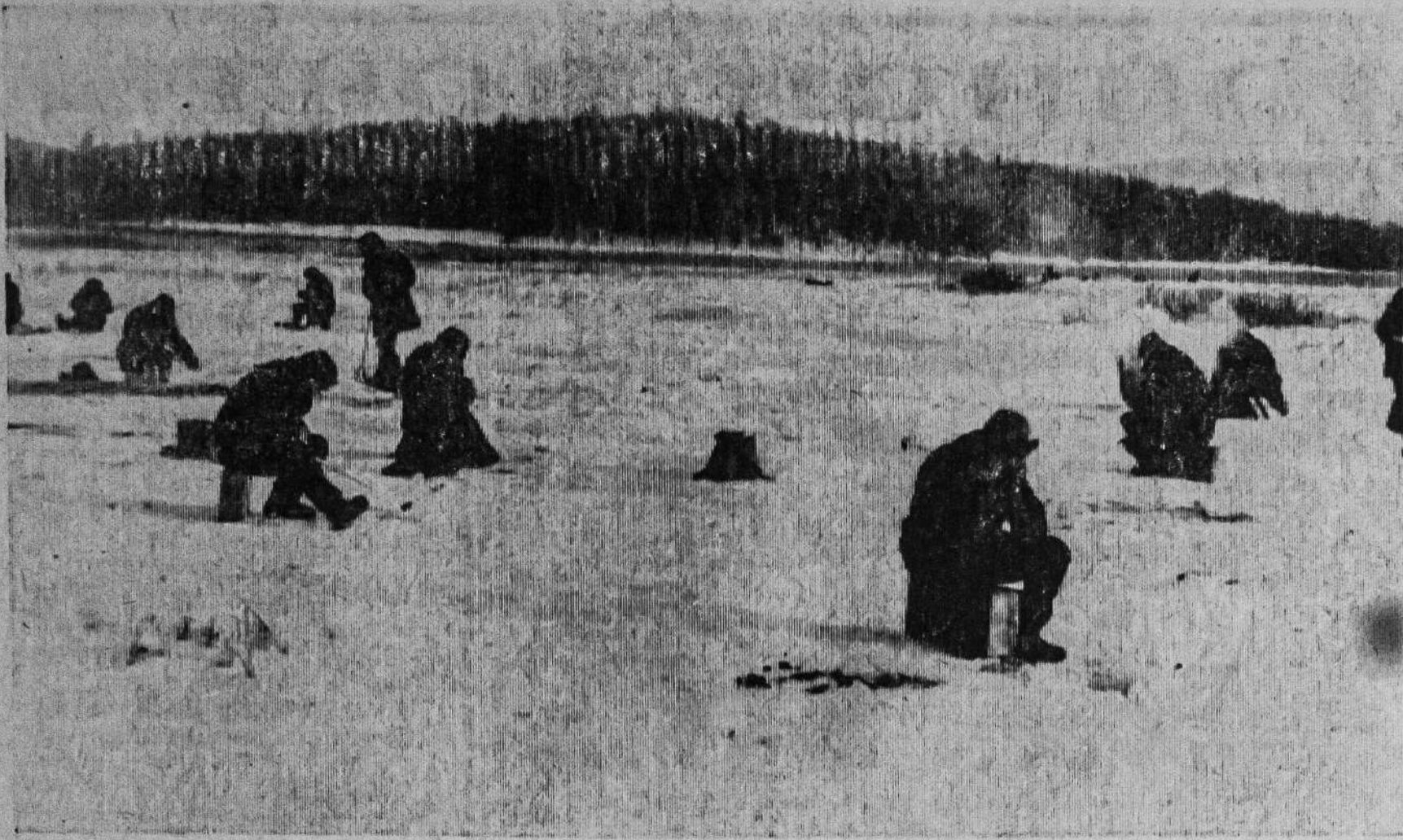
В ОЖИДАНИИ ЗОЛОТОЙ РЫБКИ.