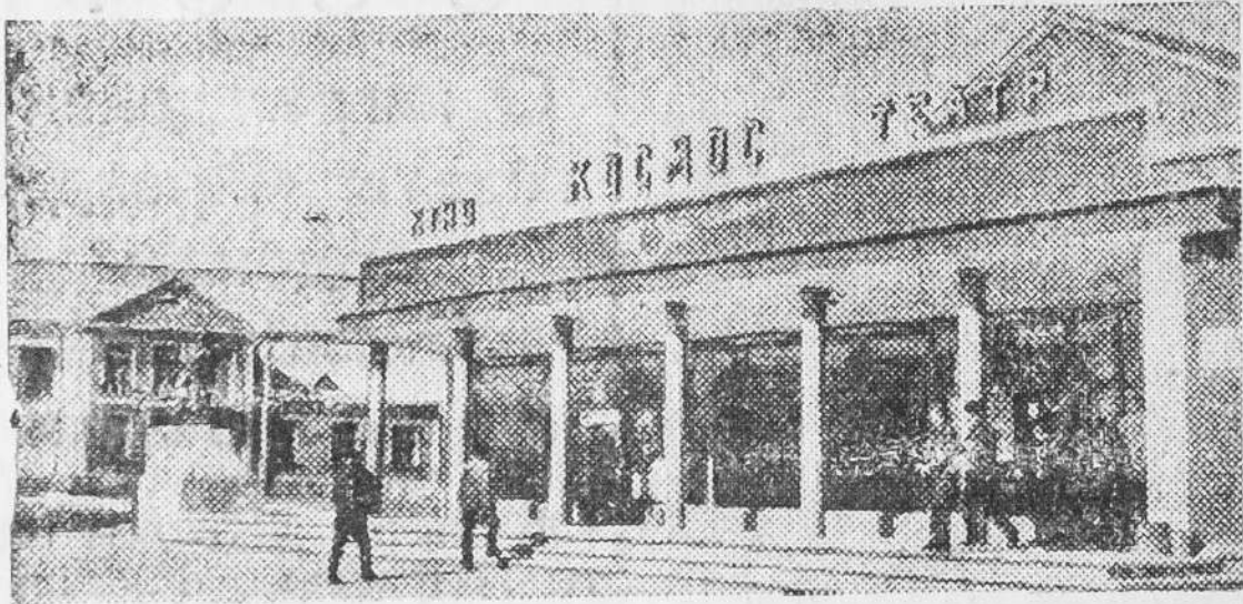
Винницкая область. В селе Тимановка Тульчинского района недавно построен кинотеатр «Космос» на 350 мест. На втором плане — колхозный Дом культуры.