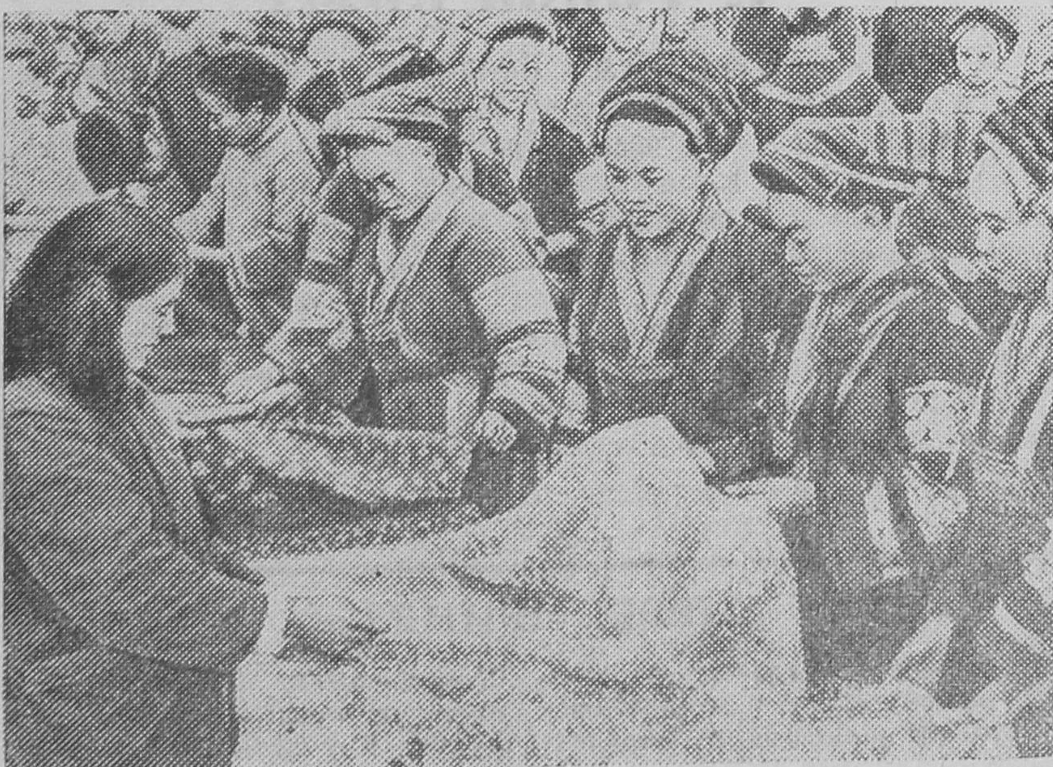
Китайская Народная Республика. Женщины—представительницы национальных меньшинств покупают ткани на сельском базаре в провинции Гуйчжоу (Юго-Западный Китай).

Митингами и демонстрациями начался месячник бойкота южноафриканских товаров также в Манчестере и Ливерпуле и во многих других городах страны.