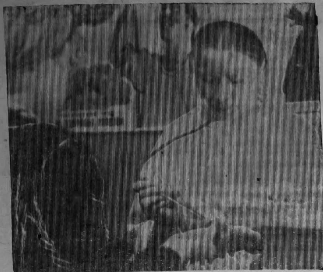
На Уральском автомобильном заводе продолжается месячник здоровья. В ходе месячника медицинские работники провели профилактический осмотр многих рабочих и служащих. Осмотр дал хорошие результаты. Осхрана здоровья рабочих с каждым годом улучшается.