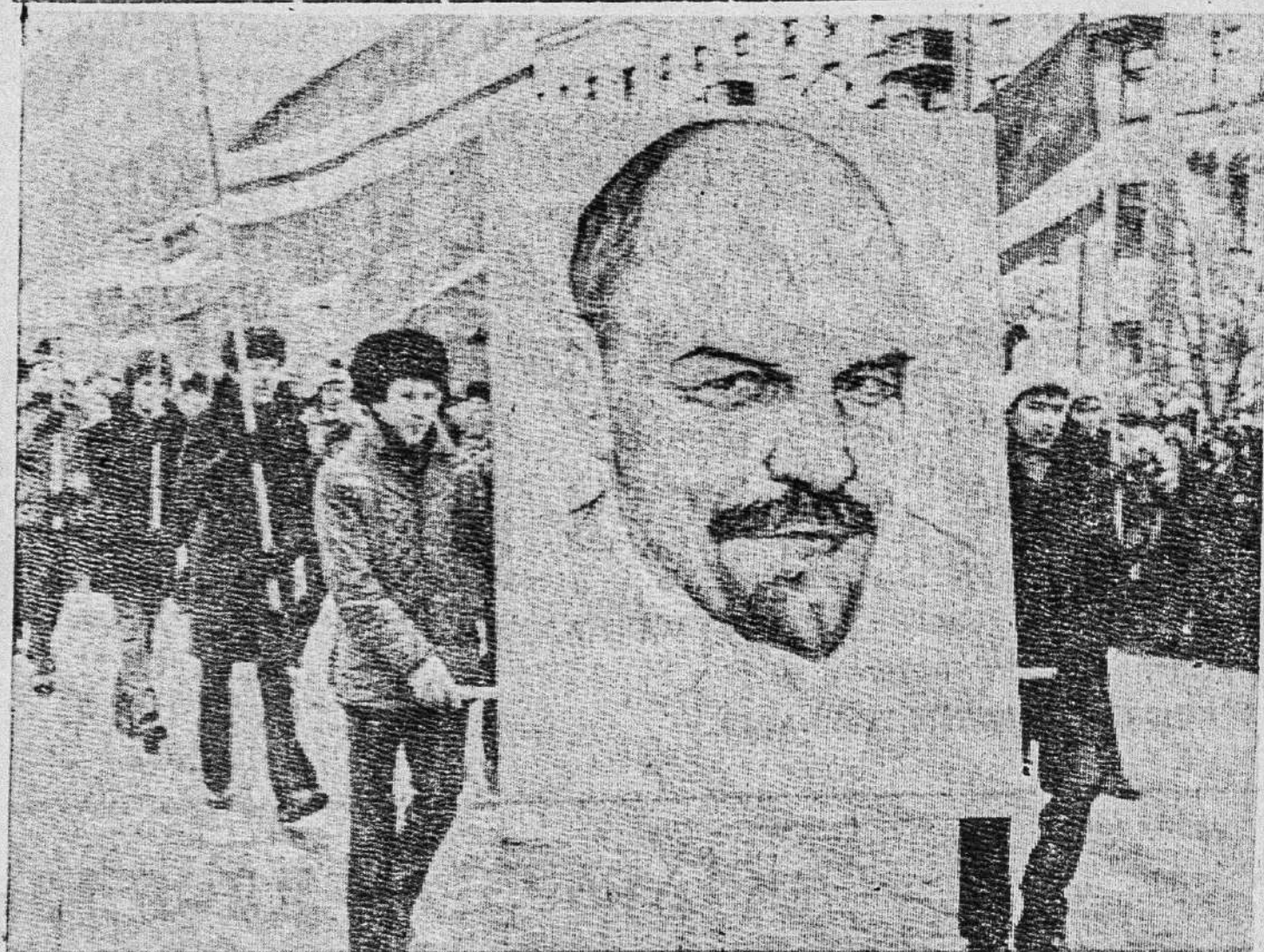
ЛЕНИН ВСЕГДА С НАМИ.