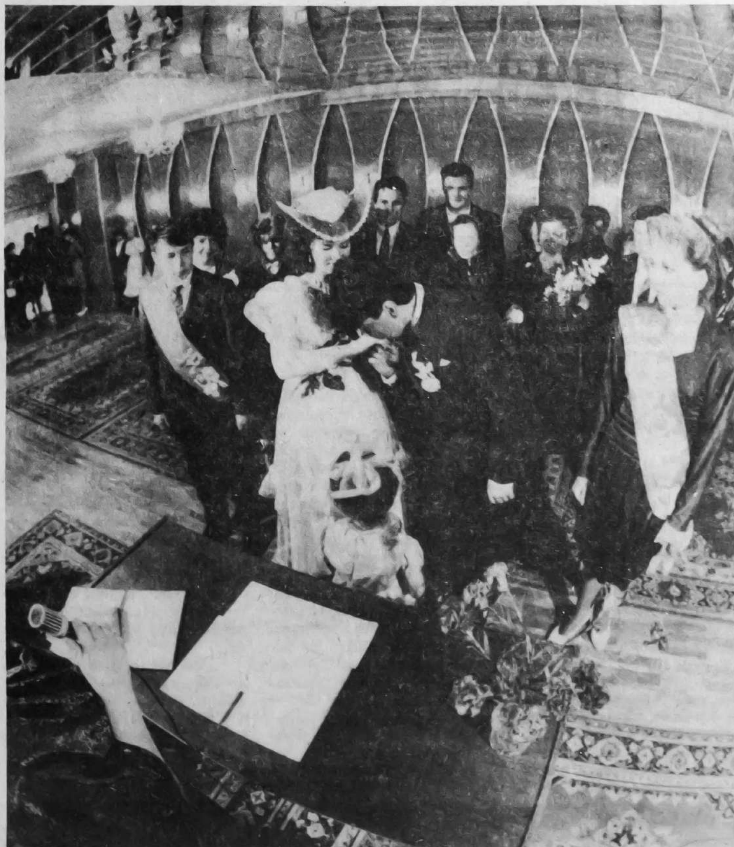
В городе — событие! Открылся Дворец бракосочетаний. Наш репортаж — на стр. 4.