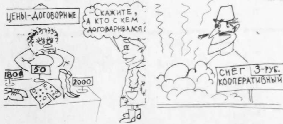
Рис. В. Жабского.