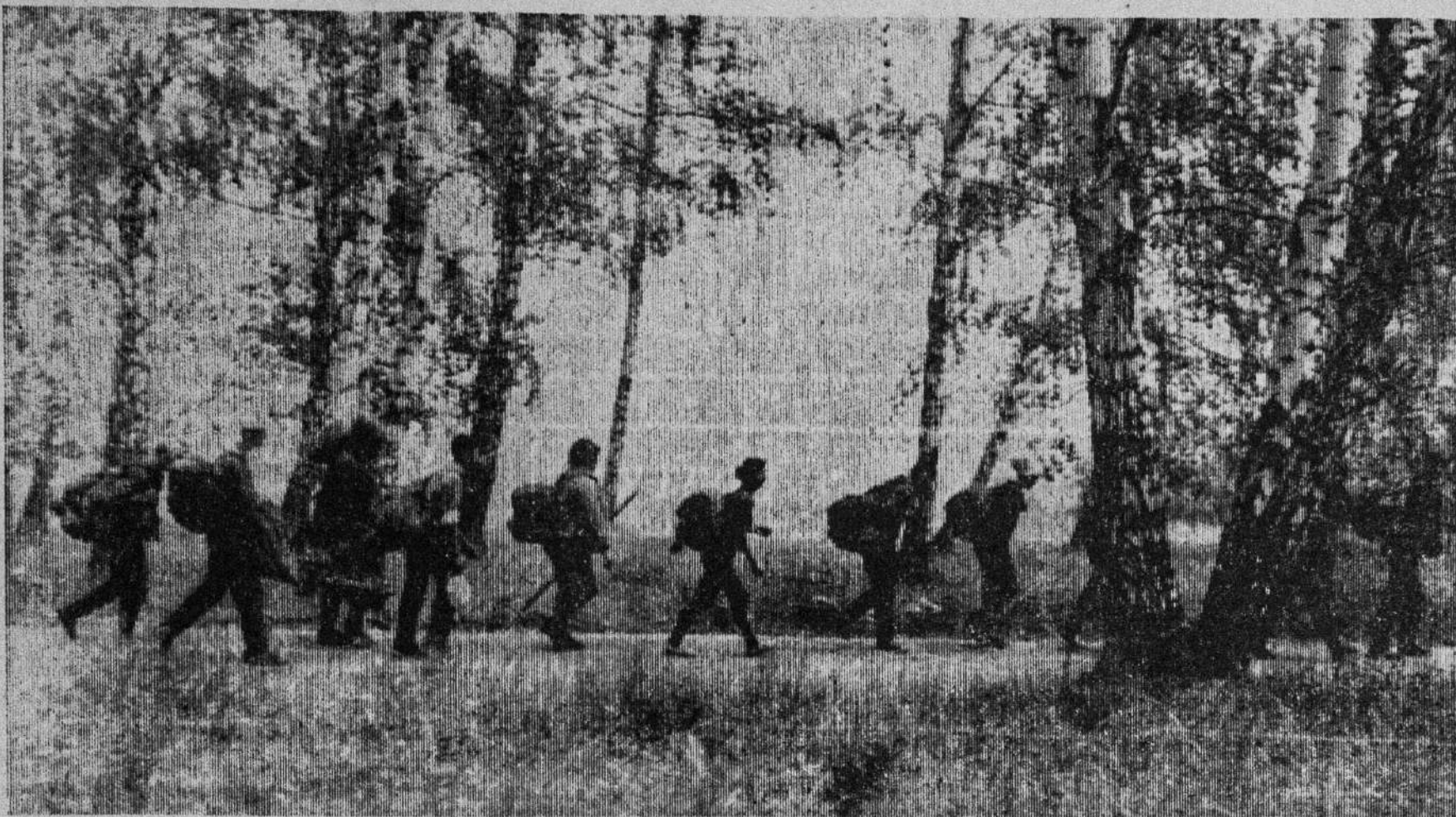
ЗОВУТ ТУРИСТСКИЕ ТРОПЫ.