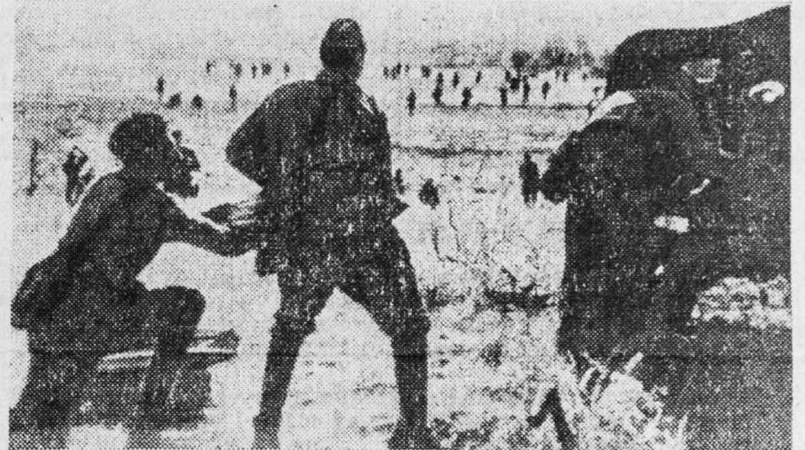
Великая Отечественная война. Бой в излучине Дона.