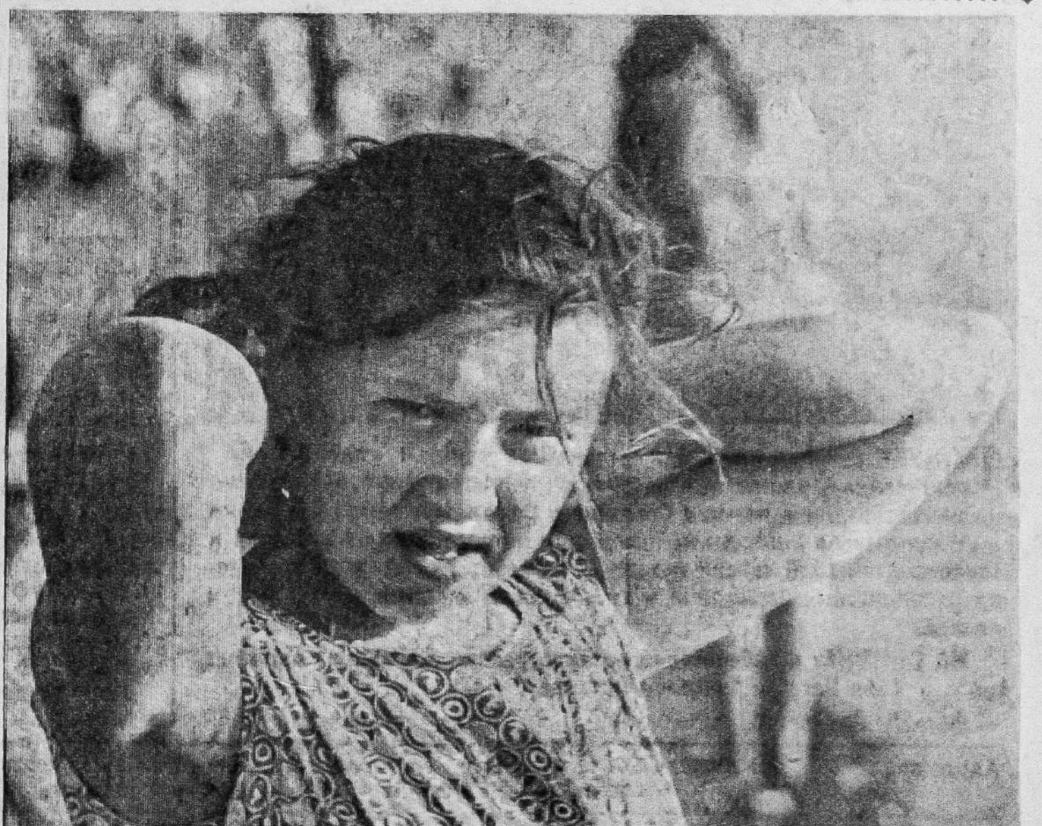
Девочка и солнце.