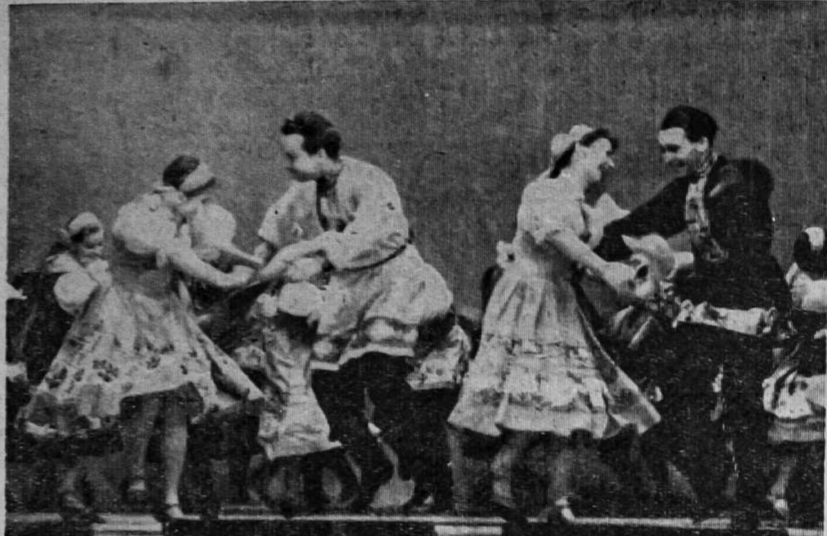
НА СНИМКЕ: народный танец в исполнении Красноярского ансамбля.

Дело будет рассматриваться в Миасском городском суде.