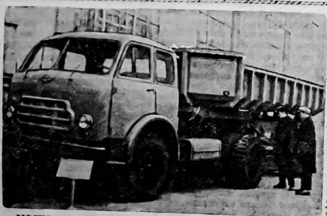
МОСКВА. На Выставке достижений народного хозяйства СССР демонстрируется новый автомобильный тягач «МАЗ-504Б» грузоподъемностью 12,5 тонны. Двигатель автомобиля развивает мощность до 180 лошадиных сил, максимальная скорость 75 километров в час.

НА СНИМКЕ: новый автомобильный тягач «МАЗ-504Б».