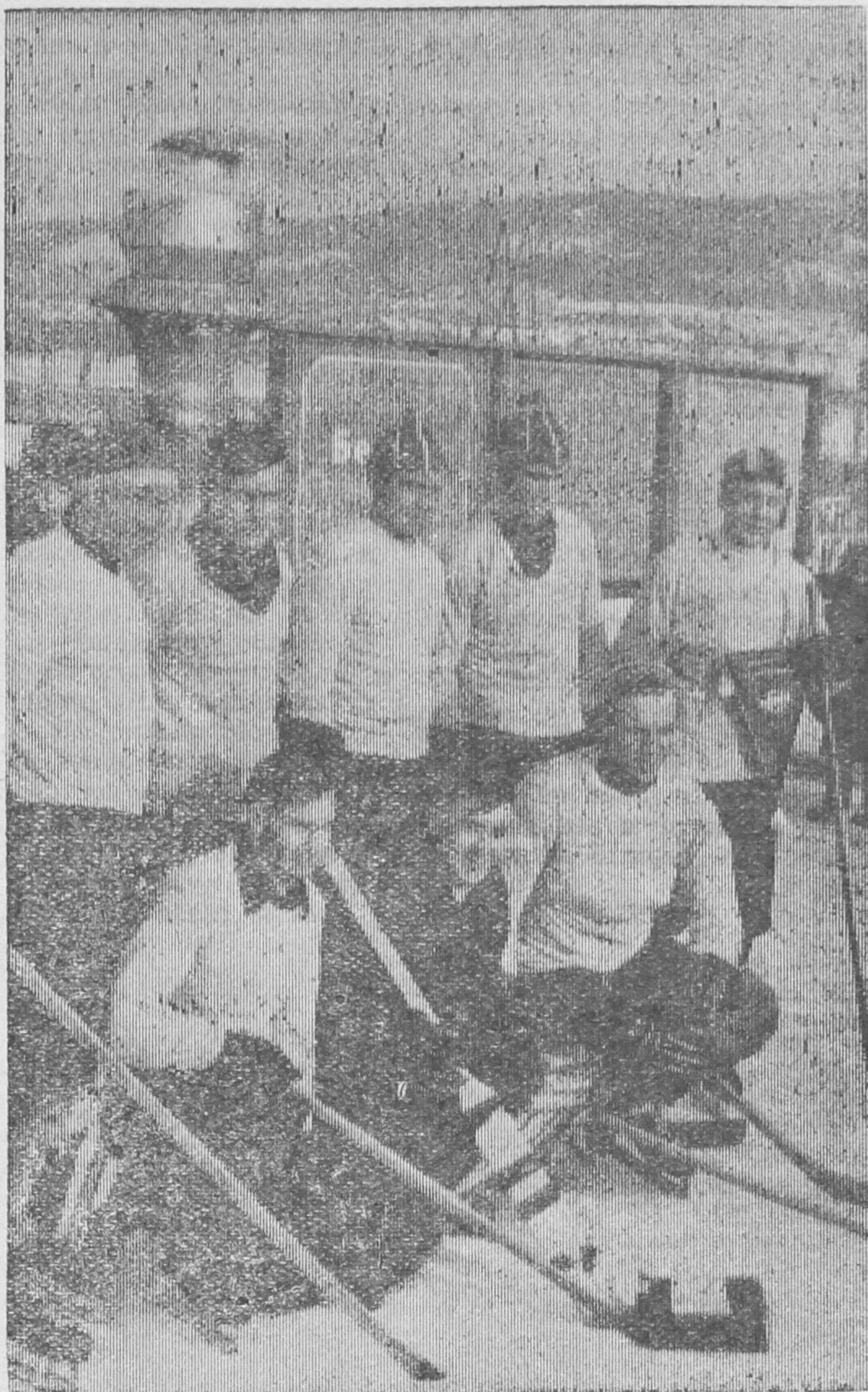
В прошедшей в нашем городе «Белой олимпиаде» отлично провела хоккейный блин-турнир команда цеха нормалей автозавода. Она завоевала приз «Солнечный камень». На снимке: члены хоккейной команды-победительницы цеха нормалей.

Ю. КОЗЫРЕВ, председатель городского совета ДСО «Труд».