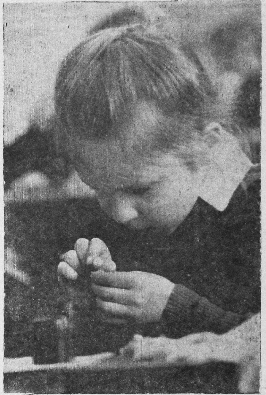
На уроке труда в школе № 10.

расчеты меткими выстрелами сбив с колокольни вражеские пулеметные гнезда и перенесли огонь на оборону врага, которая про-