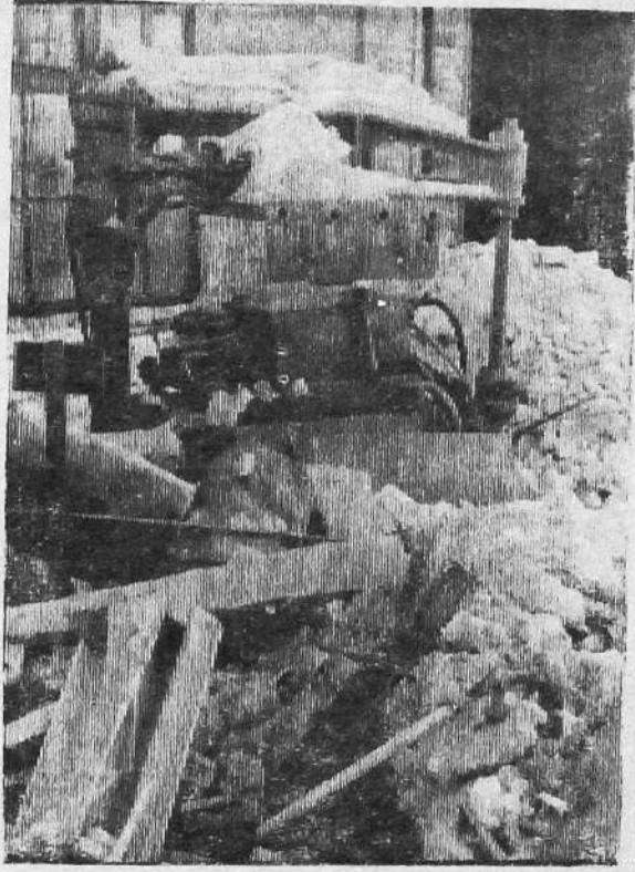
Возле первого литейного цеха автозавода стоит новая формовочная машина. Машина завалена снегом, ржавыми бочками, деревянными ящиками и другим хламом.