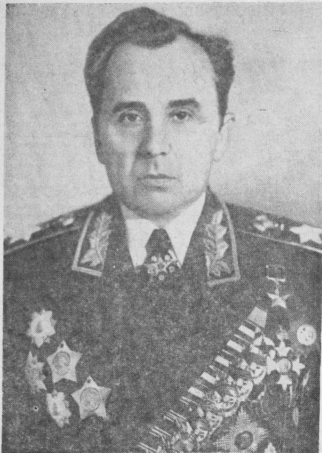
Маршал Советского Союза К. С. МОСКАЛЕНКО