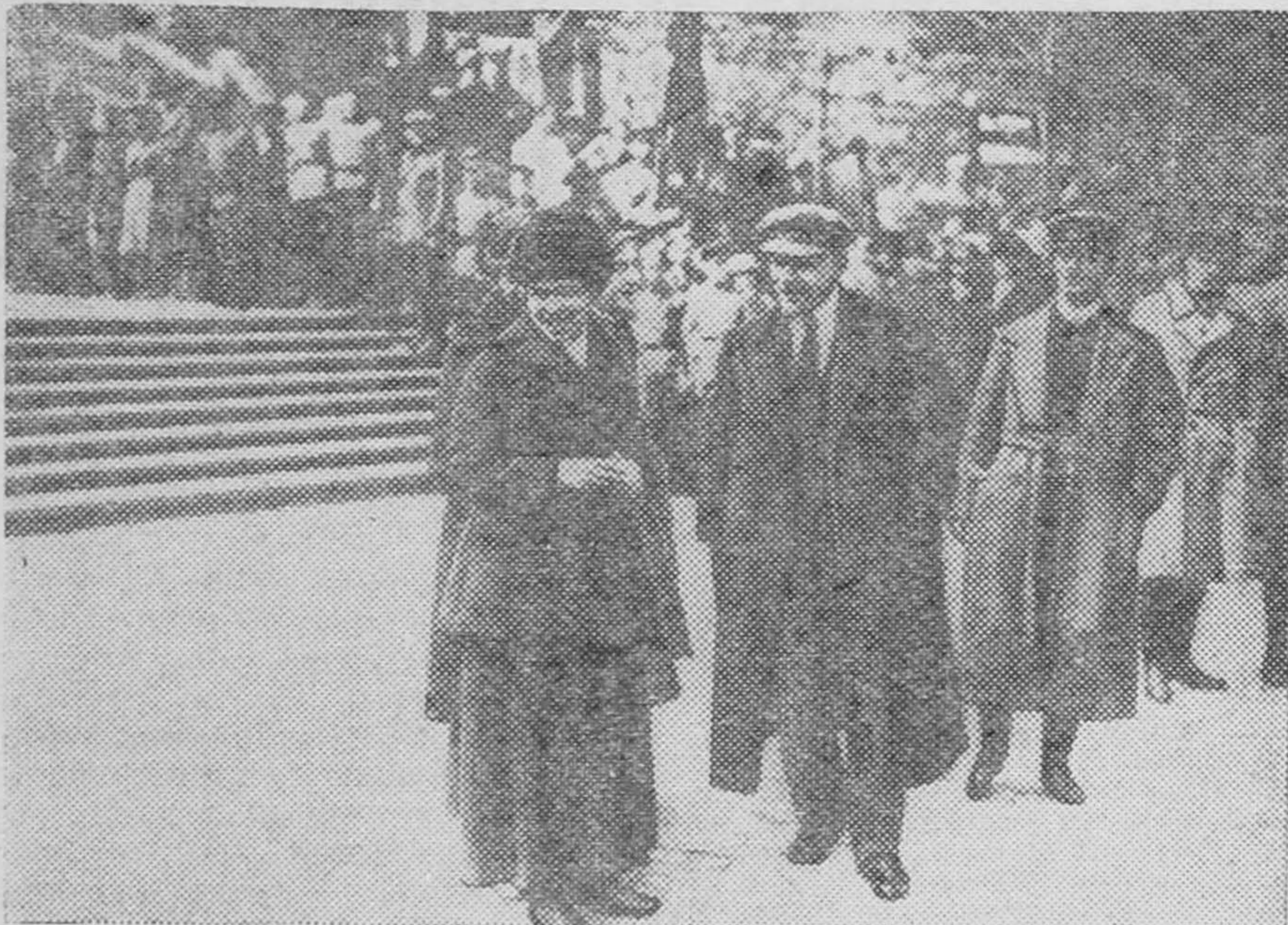
В. И. Ленин с сестрой Марией Ильиничной на Всеобуче в 1919 году в Москве.