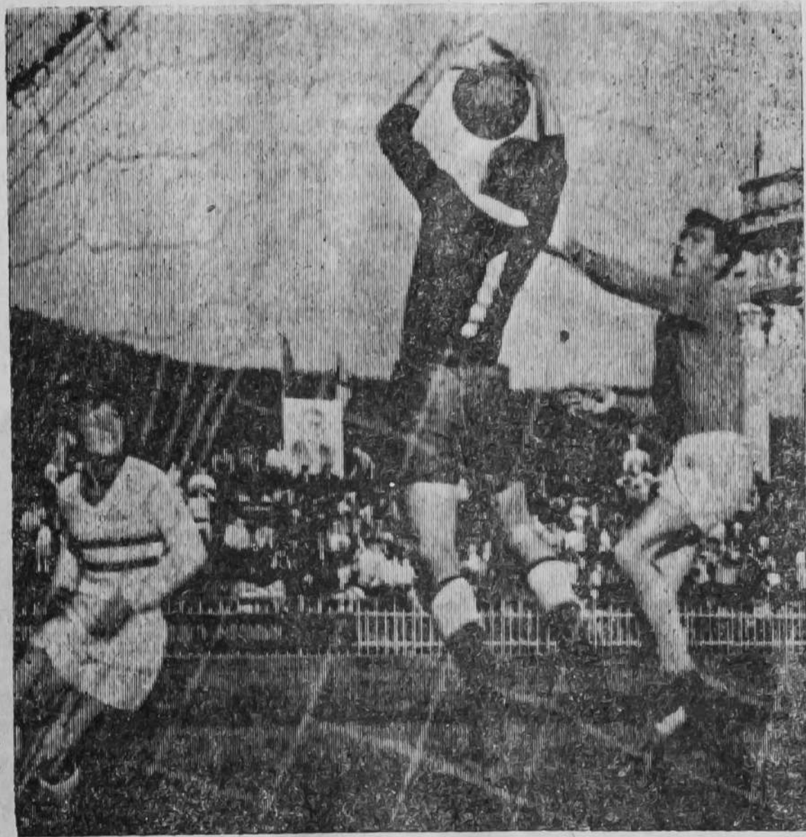
Редактор А. Ф. ФИЛИПОНЕНКО.