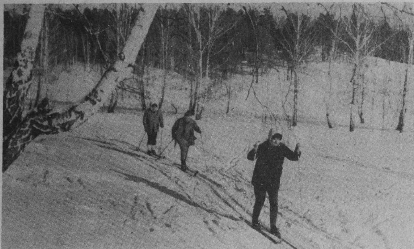
По первому снегу.