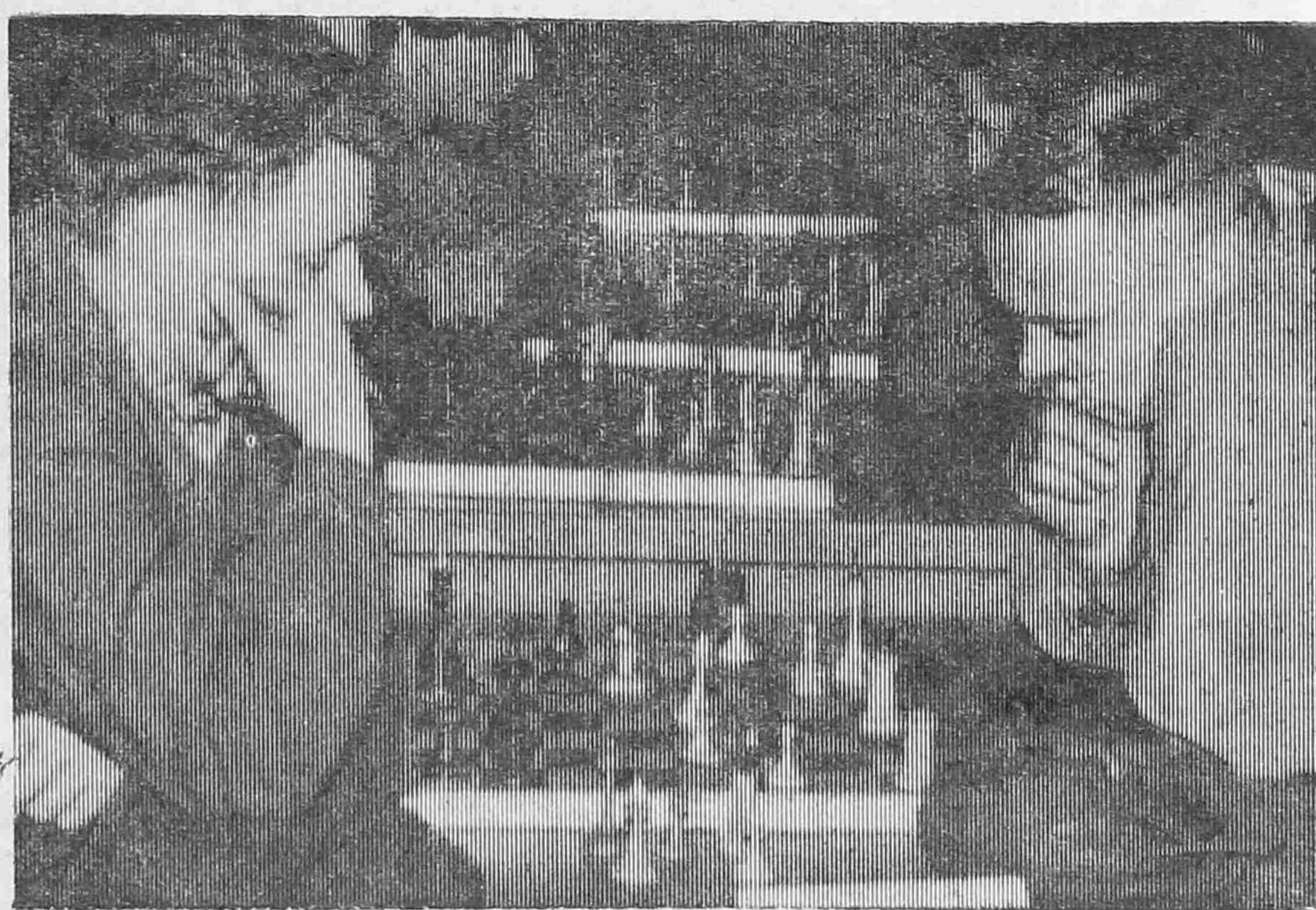
Любят свой красный уголок рабочие деревообрабатывающего цеха автозавода. В обеденный перерыв здесь все столики часто бывают заняты шахматистами.