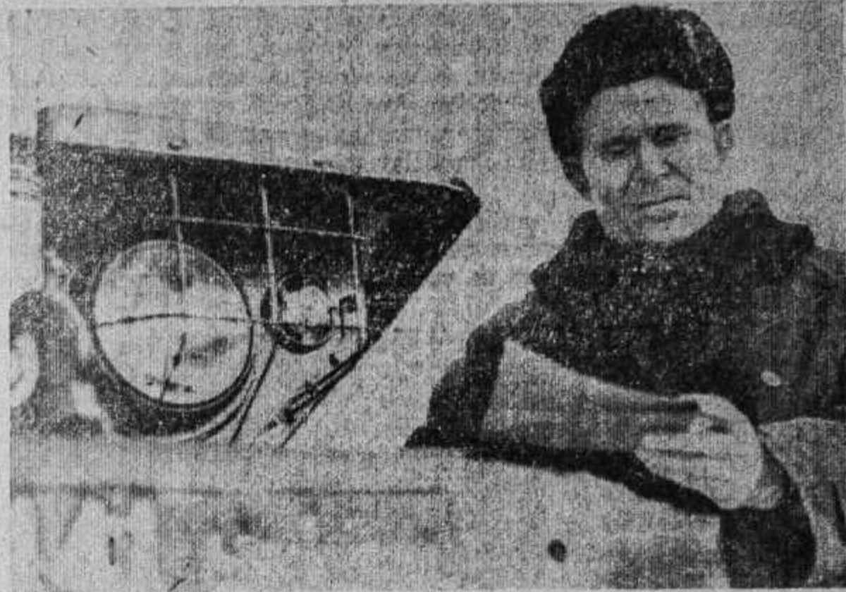
ИЗ ВОРОТ главного конвейера автозавода выходят только что собранные уральские вездеходы. Они поступают в цех испытаний и сдачи, где их осматривают опытные контролеры. Лишь после тщательной проверки и устранения дефектов, допущенных при сборке, автомобили отправляют в отдел сбыта, откуда — во все уголки страны, готовящейся отметить славное пятидесятилетие образования СССР.