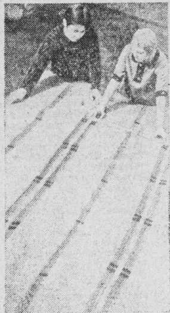
УЛЬЯНОВСКАЯ ОБЛАСТЬ. Нозомайнская ковровая фабрика славится своими изделиями. Созданные руками талантливых мастериц, они украшают клубы, Дома культуры, квартиры. Художники фабрики подготовили около 30 новых образцов.